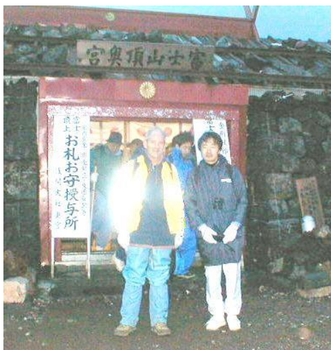
Vor dem Gipfelschrein, 6 Uhr

Der Schreinvorhof bevölkert sich, immer mehr Leute treffen ein. Einige schlagen die Schreinglocke an und verneigen sich, die meisten aber gehen achtlos unter dem Torii durch. Um 6 Uhr ertönt die Schreintrommel, die Türe öffnet sich, Zeit für die Ehrerweisung an die Gipfelgottheit(en). Gleichzeitig wird auch die "Speisehalle" geöffnet, die Bergsteiger strömen hinein. Angeboten werden Fertiggerichte: Nudeln, Curry Reis, Tee, Bier. Man sitzt auf dem Boden, eng beieinander. Danach machen wir uns auf zur Gipfelbesichtigung, es ist inzwischen ganz hell geworden.