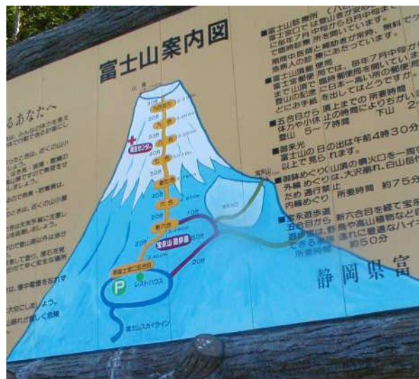
Wegbeschreibung beim Ausgangspunkt